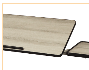
finition Cérusé pour lit 90 cm jusqu'à 1,4 m