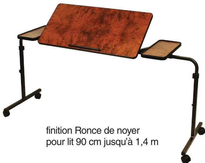
finition Ronce de noyer pour lit 90 cm jusqu'à 1,4 m