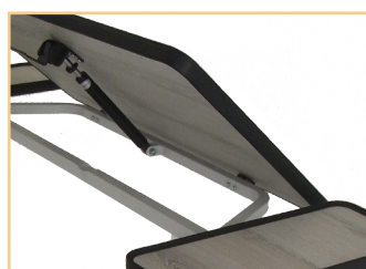
Plateau inclinable par vérin à gaz