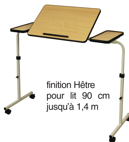
finition Hêtre pour lit 90 cm jusqu'à 1,4 m