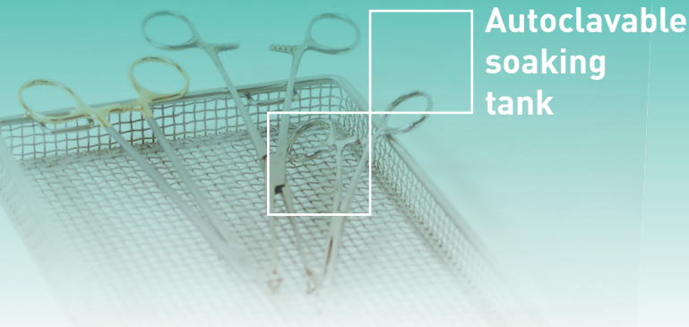
Autoclavable soaking tank